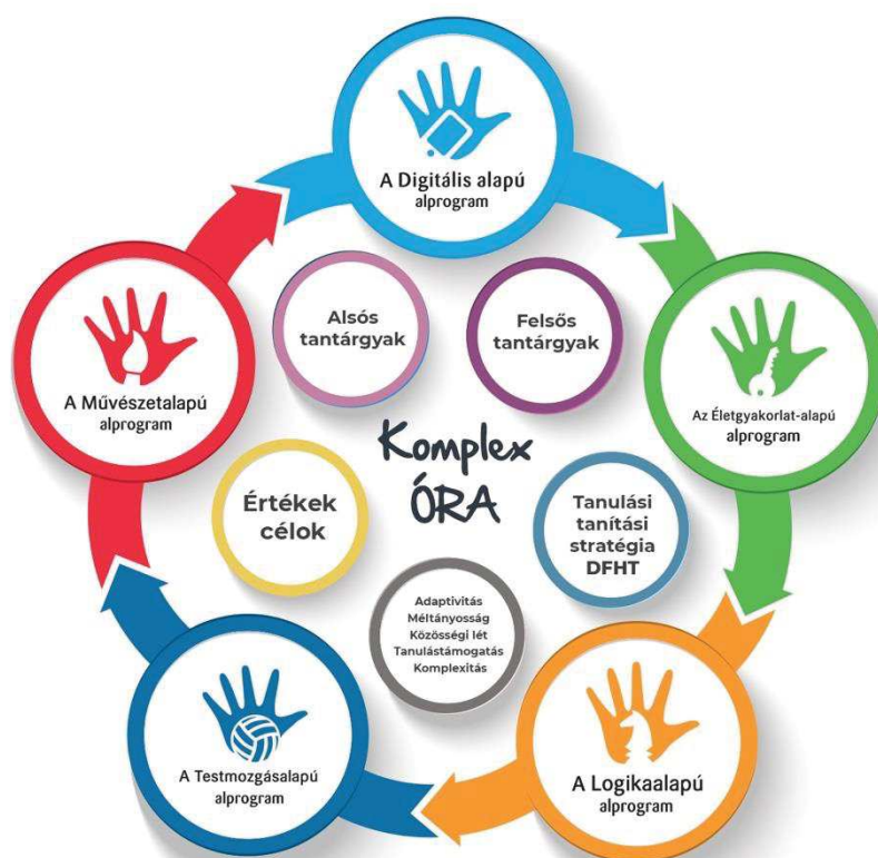
A Komplex órák felépítése